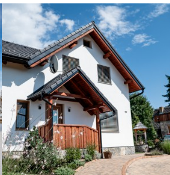
Rybářská chata Lipno