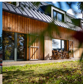
Rekreační chaty Příchovice, Jizerské hory