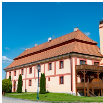
Residence Safari Resort - Hluboká u Borovan